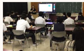
企業による進路講演会