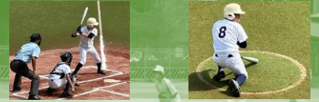
令和6年度 関東聾学校野球大会