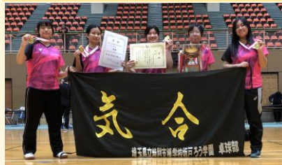
令和6年度関東聾学校卓球大会 団体戦 女子 優勝 個人戦 女子 優勝 令和6年度全国聾学校卓球大会 団体戦 女子 優勝