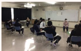
卒業生による進路講演会