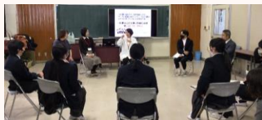
聴覚障害者協会との懇話会