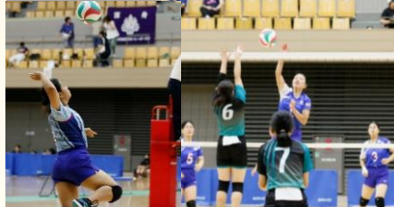
令和6年度関東聾学校バレーボール大会 第3位