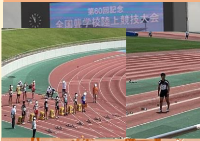
令和6年度関東聾学校陸上大会 100m、走り幅跳び 出場