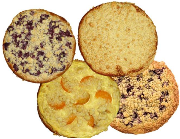
Streuselkuchen versch. Sorten