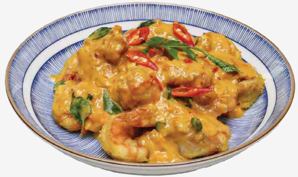
CAMARONES CON SALSA DE HUEVO SALADO 咸鸭蛋酱烤虾 / TÔM SỐT TRỨNG MUỐI