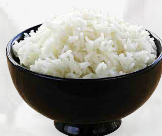
ARROZ DE JAZMIN BLANCO 白米 / CƠM THÊM