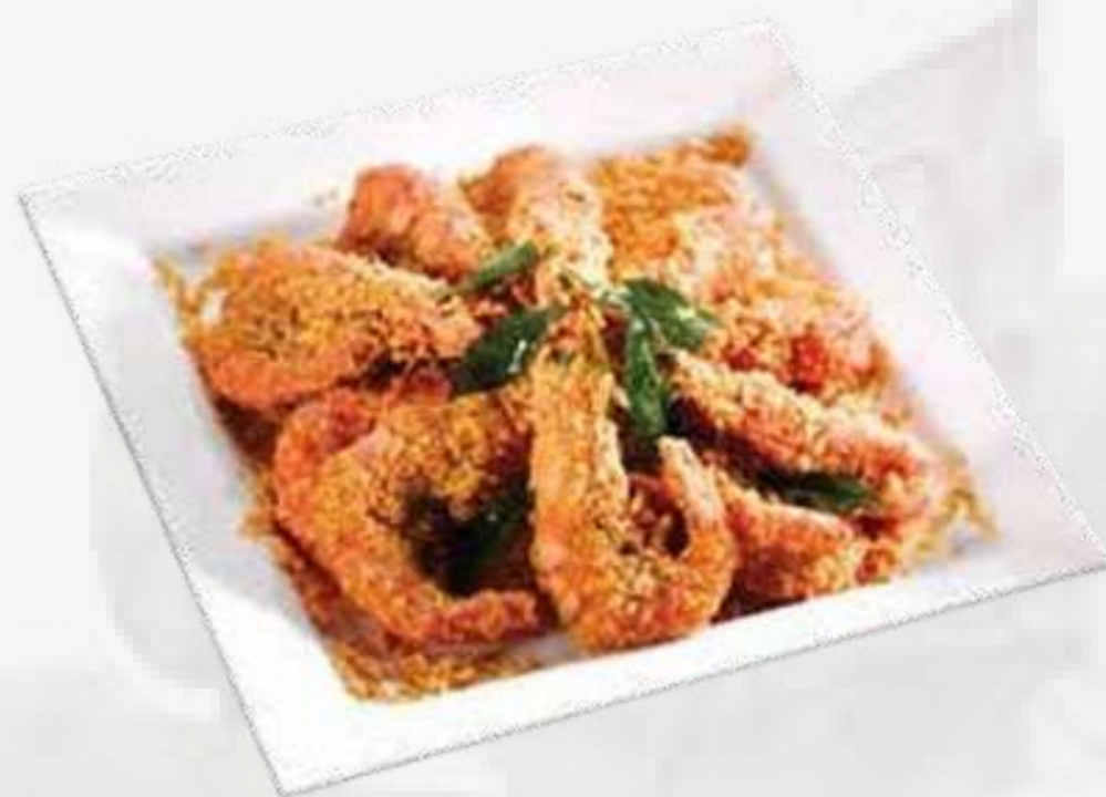
CAMARONES SALTEADO CON SAL DE CASA