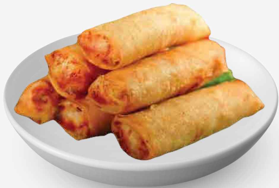
ROLLOS FRITOS DE VEGETALES 素炸春卷 / NEM CHAY