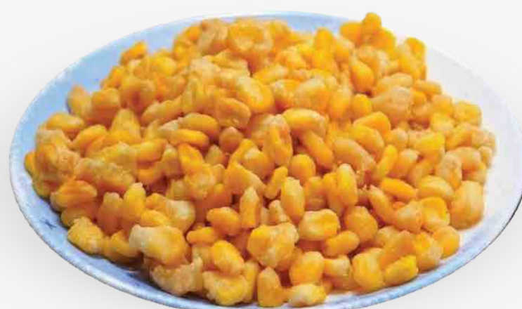
MAÍZ DULCE FRITO EN MANTEQUILLA 炸甜玉米 / NGÔ CHIÊN