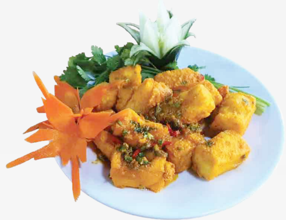
TOFU CON SALSA DE HUEVO DE PATO SALADO 咸鸭蛋炒豆腐 / ĐẬU SỐT TRỨNG MUỐI