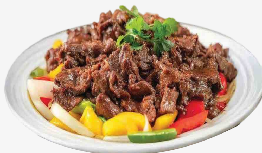
CARNE DE RES CON SALSA DE PIMIENTA 黑椒炒牛肉 / BÒ SỐT TIÊU ĐEN