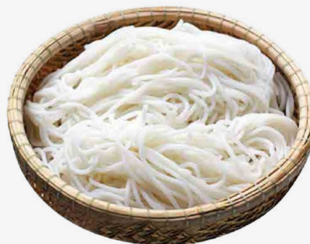
FIDEOS EXTRA 额外的面条 / PHỞ, BÚN, MỠ THÊM