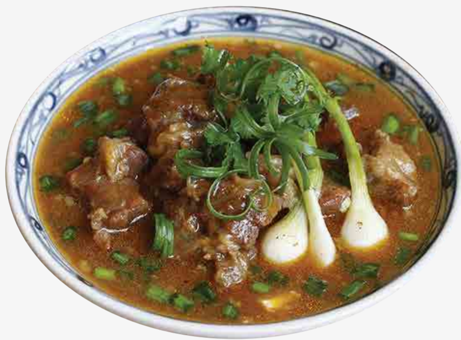
CARNE DE TERNERA ESTOFADO 酒酱牛肉 / BÒ SỐT VANG