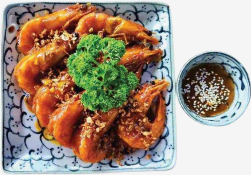
CAMARONES EN SALSA TAMARINDO 罗望子酱虾 / TÔM RANG ME