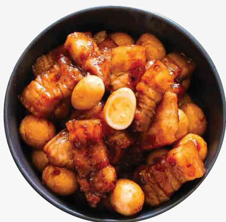
PUERCO ESTOFADO CON HUEVO 鸡蛋红烧肉 / THỊT KHO TRỨNG