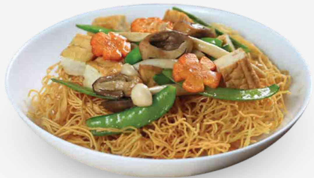
FIDEOS AMARILLO SALTEADO CON VEGETALES 素炒面 / MỠ XÀO CHAY