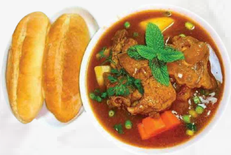
BAGUETTE CON TERNERA ESTOFADA ESTILO VIETNAMITA 酒酱牛肉面包 / BÁNH MỠ SỐT VANG