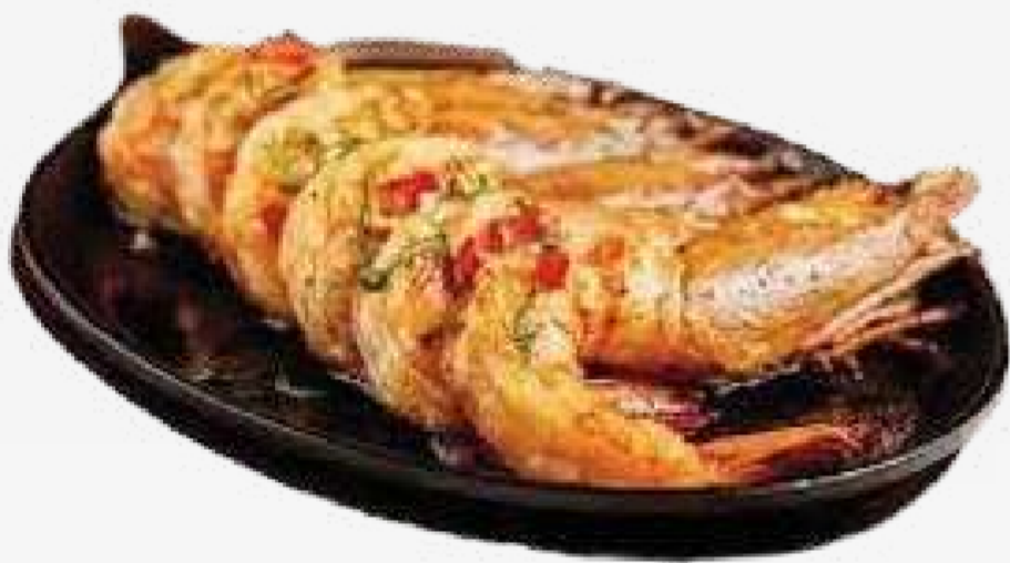
CAMARONES CON SALSA DE MANTEQUILLA Y AJO 烤虾配黄油和蒜酱 / TÔM BƠ TỎI