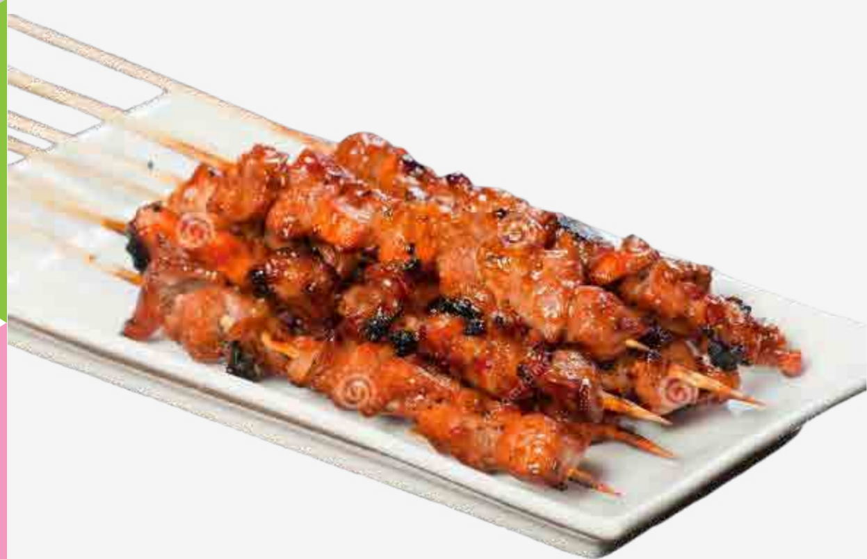
BROCHETA DE PUERCO CON SALSA MIEL 蜜汁烤猪肉串 / LỢN NƯỚNG MẬT ONG