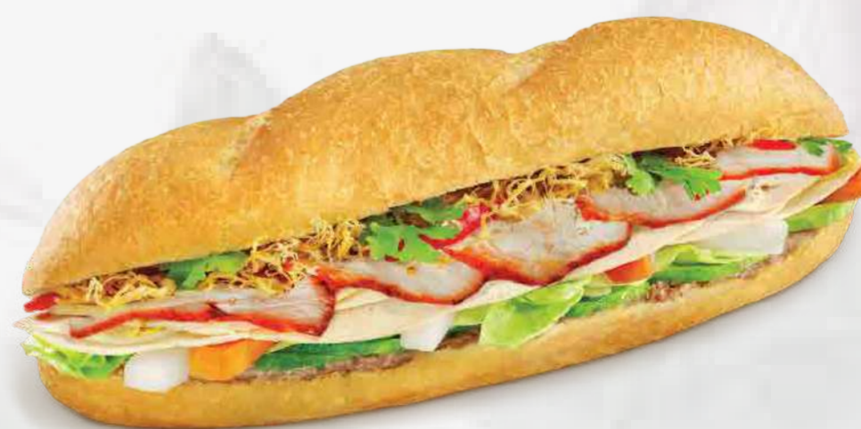
EMPAREDADOS VIETNAMITA DE PUERCO ESTILO CHARSIU 叉烧面包 / BÁNH MỠ XÁ XÍU