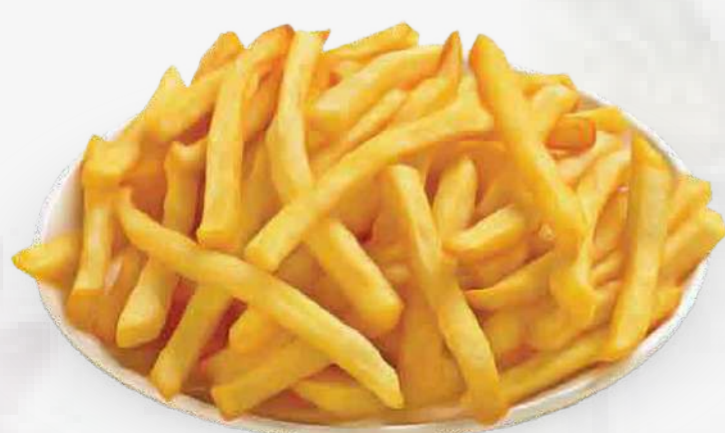
PAPAS FRITAS 炸薯条 / KHOAI TÂY CHIÊN