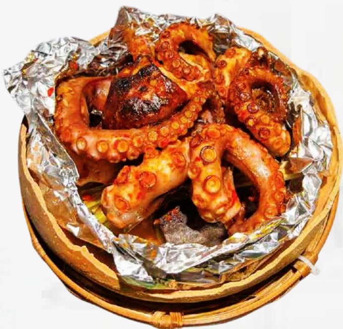
PULPO A LA PARRILLA CON PICANTE O SIN PICANTE