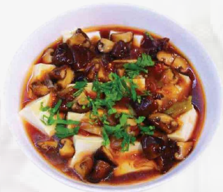
TOFU CON SALSA DE HONGOS 蘑菇酱豆腐 / ĐẬU SỐT NẤM