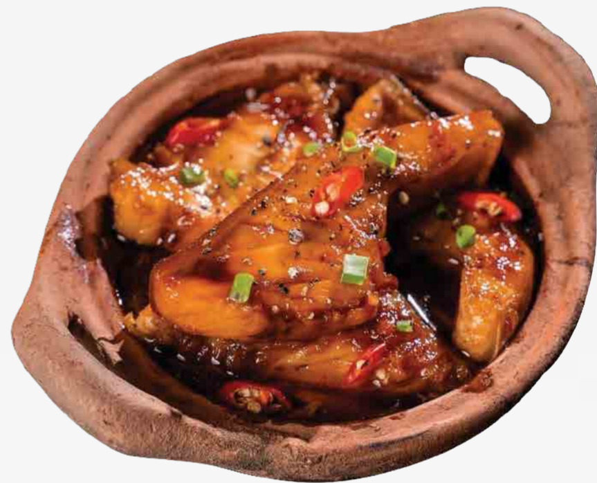
PESCADO CAMELIZADO 酒酱牛肉 / CÁ KHO