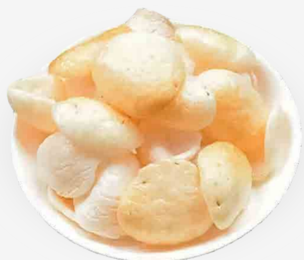
GALLETAS DE CAMARONES 越南炸虾饼 / BÁNH PHỒNG TÔM