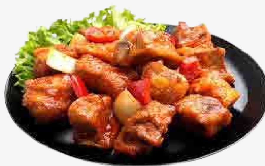
COSTILLA CON SALSA AGRIDULCE 糖醋排骨 / SƯỜN SỐT CHUA NGỌT