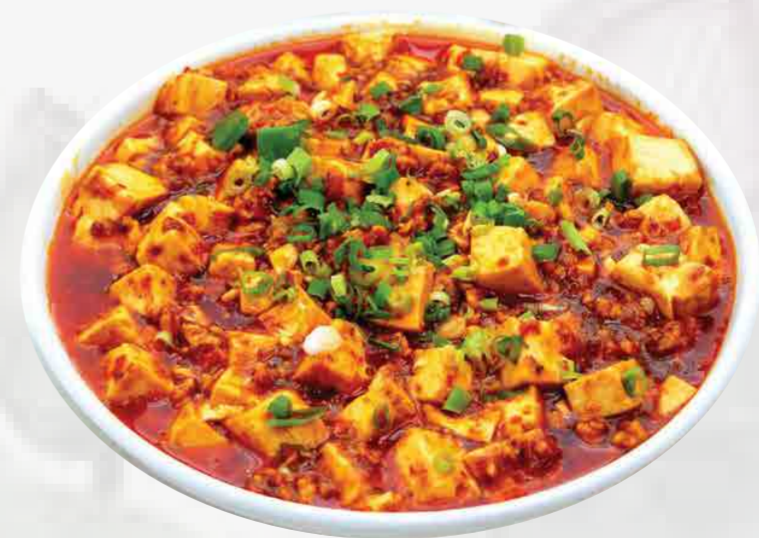
TOFU CON SALSA DE RES Y PICANTE 辣牛肉酱蒸豆腐 / ĐẬU PHỤ SỐT BÒ CAY